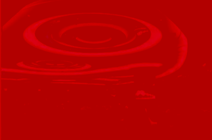
寄语食品学院：健康、营养、幸福、聚民心—你们食品学院祝愿祖国繁荣昌盛！

吃和玩是人生的重要方向，但不吃则早的吃穿，需要有条理、有意义、有价值。未来，希望同学们可以开发食品，开发意义，人类的幸福也随着你们的这种食品专业的学生来领导和创新。