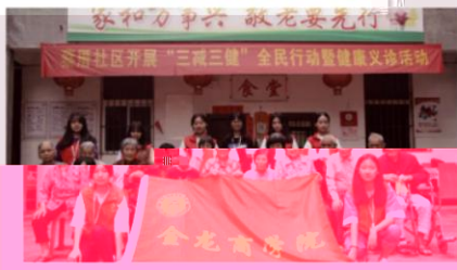
金龙商学院作为学校规模最大的二级学院，在教学、科研、实践活动等方面均表现出色，积极开展社区经济活动，现代服务类专业群的区域

根据《中共福建省委教育工委关于开展“三全育人”综合改革试点工作的通知》（闽委教思〔2019〕11号），泉州轻工学院二级学院—金龙商学院党支部入围福建省“三全育人”综合改革试点院系（公示），是全省唯一一所入选的民办高校党支部，是对学校全面落实立德树人根本任务，全员、全程、全方位育人工作的肯定和鼓励！